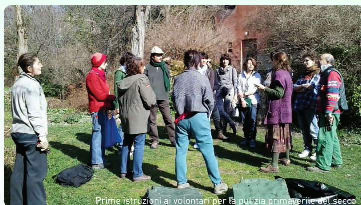
Prime istruzioni ai volontari per la pulizia primaverile del secco

ANCHE IL VOLONTARIATO è un modo per aiutare la conduzione del Giardino e sta diventando sempre più importante l'opera dei volontari. Oltre all'ormai tradizionale incontro collettivo autunnale del GIORNOFOGLIA, si è tenuto quest'anno anche un incontro collettivo di fine inverno per la pulizia del secco. Per la prima volta, in un solo giorno, grazie a dodici volontari, si è concluso un lavoro che, altrimenti, avrebbe richiesto più di una settimana. L'incontro collettivo per la pulizia del secco, quindi, rientrerà a far parte degli incontri tradizionali e, in questo 2015 è già fissato per domenica 8 marzo. Per il GIORNOFOGLIA, invece, ci si incontrerà domenica 15 novembre. Continuano, preziosi e sempre molto utili, gli interventi saltuari di singole persone o piccoli gruppi, durante tutto l'arco dell'anno.