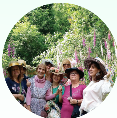
L'allegro gruppo dei visitatori di Pistoia fra le digitali

LE VISITE Da quando, nel 2007, si è istituito un contributo di 10 euro per la visita guidata al Giardino, questa si è fatta, nel tempo, sempre più impegnativa (per la "guida" e...per i visitatori!) perché il patrimonio botanico è in costante espansione, ma anche per il desiderio di passare la più grande quantità possibile di conoscenze e informazioni per un giardinaggio rispettoso di Madre Natura. La stessa nascita della Fondazione è avvenuta per permettere a questo importante messaggio del Giardino di continuare ad essere proposto ed è per lo stesso motivo che le visite dovranno essere sempre guidate e ampiamente dettagliate (nella maggior parte dei giardini sono invece libere). D'altro canto, insieme alle donazioni degli Amici, le visite costituiscono anche le uniche fonti di sovvenzionamento per la vita del luogo e quindi il Consiglio della Fondazione ha deciso che il contributo venga portato a 15 euro e che sia