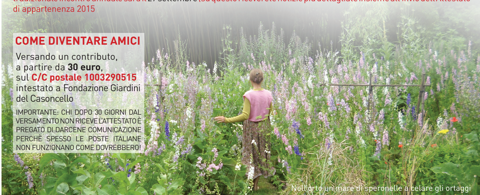
Nell'orto un mare di speronelle a celare gli ortaggi

IMPORTANTE: CHI DOPO 30 GIORNI DAL VERSAMENTO NON RICEVE L'ATTESTATO È PREGATO DI DARCI COMUNICAZIONE PERCHÉ SPESSO LE POSTE ITALIANE NON FUNZIONANO COME DOVREBBERO!